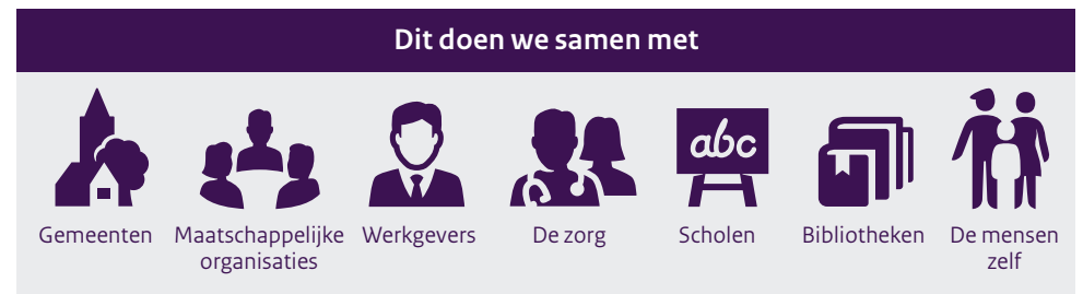
Figuur 4.1 Samenwerkingspartners overheid in aanpak laaggeletterdheid

Een van de twee hoofddoelstellingen van het programma ‘Tel mee met Taal 2016-2018’ was: in elke arbeidsmarktregio komt tussen gemeenten en lokale partners een duurzame samenwerking tot stand om de laaggeletterdheid te voorkomen en te bestrijden. Uit een evaluatieonderzoek blijkt dat de kwantitatieve doelstelling (om een regionaal Taalakkoord te hebben in tenminste 30 arbeidsmarktregio’s) niet is behaald, maar dat ‘Tel mee met Taal’ wel heeft bijgedragen “aan de verduurzaming van (al dan niet eerder opgezette) regionale taalnetwerken in de meeste arbeidsmarktregio’s” (Sapulete et al., 2019). Doordat relevante partijen zich hebben aangesloten bij het Taalakkoord Werkgevers en/of een regionaal Taalakkoord, wordt het belang van het stimuleren van taalvaardigheid bij werknemers erkend. Binnen de regionale Taalakkorden wordt tevens ingezet op het bereiken van laagtaalvaardige gezinnen en – via een taalaanbod – de